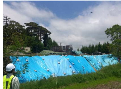
写真-UAVによる空中写真撮影風景

利用目的が公共測量の場合は「UAV を用いた空中写真測量マニュアル(案)」に準じた評定点や検証点を設置し、所定の精度管理を行います。