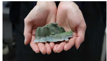
写真-手のひらサイズでの出力例

1 個あたりの最大出力サイズ 254×381×203mm で、より大きなサイズでの出力を希望される場合には、3D データを分割し複数回に分けて出力します。